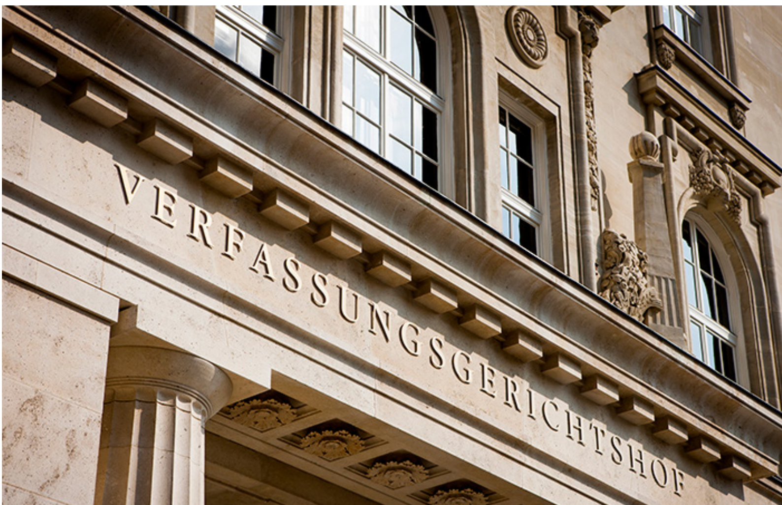
Der Verfassungsgerichtshof als „Hüterin der Verfassung“

Die Entwicklung der Verfassung spiegelt auch die Geschichte eines Landes wieder. In der Storymap findest du eine Auswahl, wie Verfassungen in anderen europäischen Ländern geregelt sind.