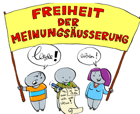
Freie Meinungsäußerung