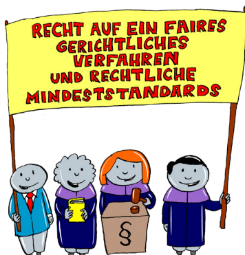
Faires Gerichtsverfahren © Parlamentsdirektion / Kinderbüro / Leopold Maurer