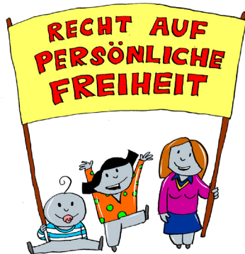
Persönliche Freiheit

An den folgenden Beispielen kannst du leicht erkennen, dass die Grundrechte ganz besonders wichtige Rechte sind: